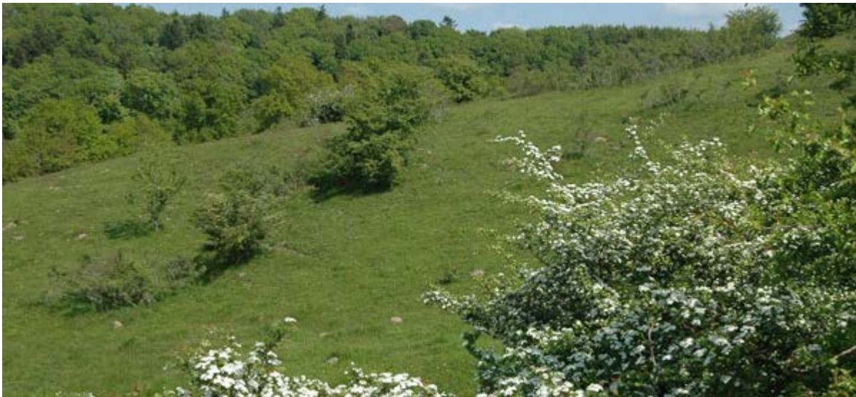
Der bliver også tid til at botanisere på overdrevet ved Tågelund

DN´s Naturplejenetværk og Vejle kommune samarbejder om pleje af overdrev og kær i de smukke, kuperede landskaber i Vejle Ådal og ved Egtved Å og Engelsholm Sø.