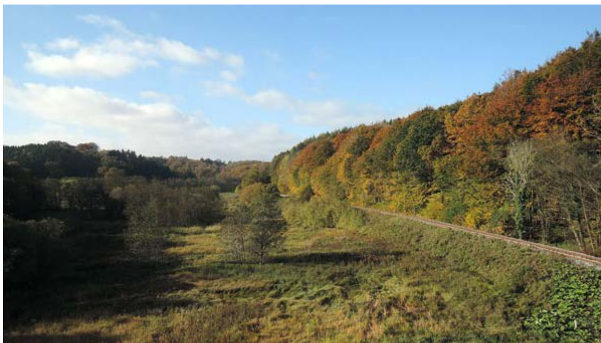
Grejs Ådal, en sidedal til Vejle Ådal

Vejle Fjord og Vejle Ådal med sidedale er den mest imponerende af de dale, der præger Jyllands østkyst. Dette var grundlaget for, at området i 2009 blev en del af Danmarks naturkanon.