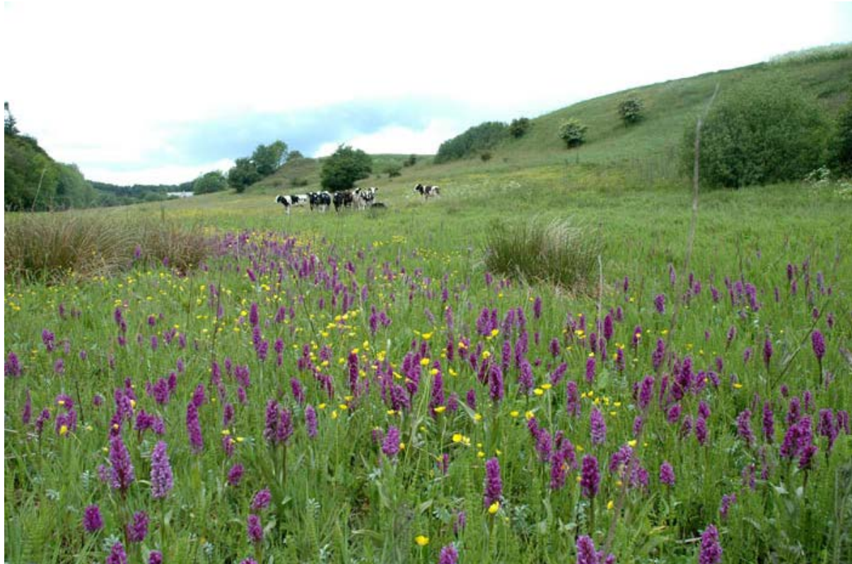
Værdifulde enge og overdrev ved Fløjstrup Bæk.

Vejle Kommune har i sommerens løb vedtaget en naturkvalitetsplan. Naturkvalitetsplan 2015-2025 omfatter de naturtyper, som er beskyttet mod tilstandsændringer efter naturbeskyttelsesloven § 3. Det vil sige overdrev, moser, ferske enge, strandenge, vandhuller og søer.