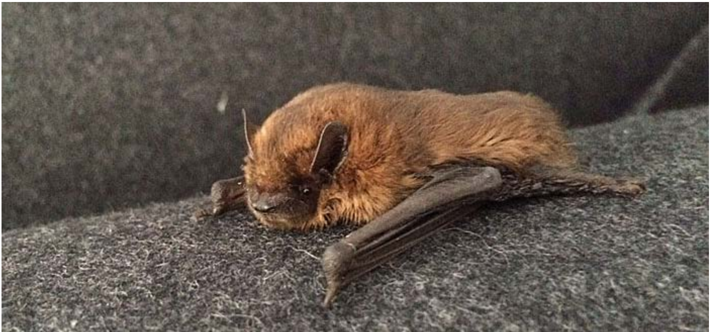
Brunflagermus, Danmarks største flagermus

Vi er nu i gang med at registrere flagermus i Vejle Kommune. Flagermusenes skrig optages på et lydkort, som kan aflæses med computerprogrammet Batsound. I en have i Grejsdalen fandt vi 6 arter: Brun-, Syd-, Dværk-, Pipistrel-, Trolde- og Vandflagermus.